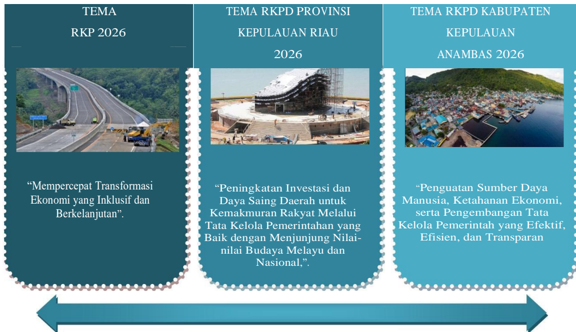
Gambar 2.3 Keterkaitan Tema RKP 2026, Tema RKPD Provinsi Kepulauan Riau 2026, dengan Tema RKPD Kabupaten Kepulauan Anambas 2026

Selain berpedoman pada pencapaian target kinerja pada tahun ke 2 RPJMD Kabupaten Kepulauan Anambas, penetapan prioritas pembangunan juga dilakukan dengan memperhatikan rencana pembangunan pada level yang lebih tinggi yaitu RKP tahun 2026 serta RKPD Provinsi Kepulauan Riau tahun 2026. Matriks Keterkaitan perencanaan pembangunan nasional, regional Kepulauan Riau dengan RKPD Kabupaten Kepulauan Anambas terlihat pada gambar di bawah ini: